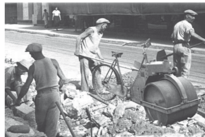
Plonk et Replonk